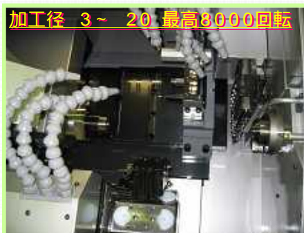
加工径 3 ~ 20 最高3000回転

シチズンM20V。時計ではありません。でも当然精密機械です。一般に自動盤と呼ばれています。3メートルまでの丸棒材を飲み込んでしまいます。見津が丘工場の最上位機種です。